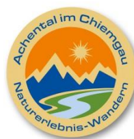
Gold 40 Punkte