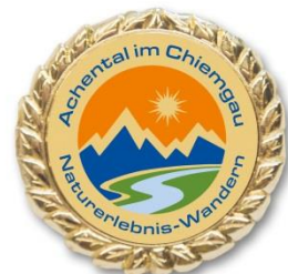
Eichenlaub 80 Punkte

Kinder bis 12 Jahre, Menschen mit Behinderung, sowie Gäste über 60 Jahre erhalten 20% Bonus auf die schon erwanderten Punkte.