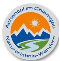
Silber 20 Punkte