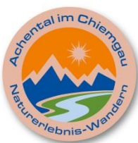
Bronze 10 Punkte

Als Belohnung für Ihre Mühen erhalten Sie die beliebten Achental Wandernadeln, die je nach erreichter Punktzahl variieren: